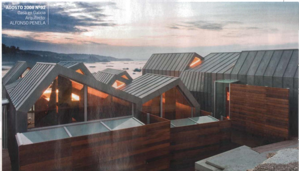
AGOSTO 2008 N°92 Casa en Galicia Arquitecto: ALFONSO PENELA

Uno de los valores de la arquitectura contemporánea es su capacidad para dialogar con el entorno natural, para extraer su fuerza de las condiciones locales del entorno donde se inserta. Gracias a ese valor, la arquitectura española es tan variada como lo es el territorio. El Mediterráneo tiene una tradición y es fuente de una cultura que se diferencia de las del Atlántico o el Cantábrico. No se puede hacer arquitectura sin tener en cuenta la tradición edilicia y no es posible sustraerse al contexto porque el territorio no es un papel en blanco, sino todo lo contrario. La arquitectura que es generosa con la naturaleza lo es con el hombre.