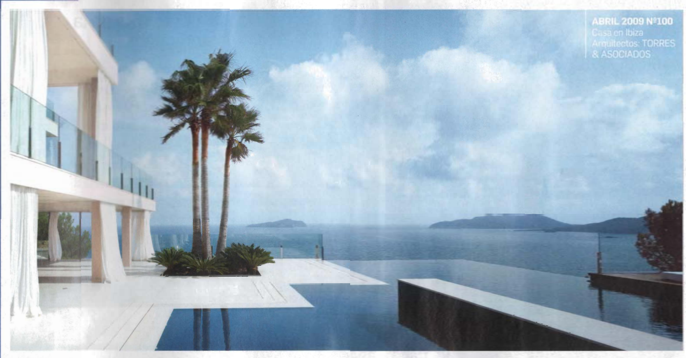
ABRIL 2009 N°100 Casa en Ibiza Arquitectos: TORRES & ASOCIADOS