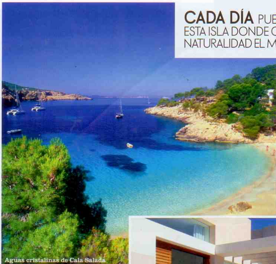
Aguas cristalinas de Cala Salada

CADA DÍA PUEDE SER INOLVIDABLE EN ESTA ISLA DONDE CONVIVEN CON TODA NATURALIDAD EL MAR, LA CALMA Y LA FIESTA