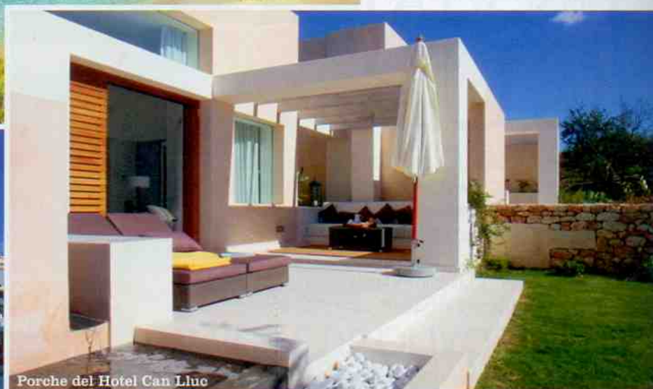
Porche del Hotel Can Lluç

Hotel Can Lluç Este ecohotel al pie de la montaña está edificado sobre una finca payesa del siglo XVIII. El nieto del dueño la convirtió en casa rural de lujo con 12 habitaciones de ambiente zen. Dos placeres: el jardín lleno de higueras con una piscina que mezcla agua dulce y salada y los desayunos en el porche. Una idea: la greixonera , mezcla de pastel dulce y ensaimada. ◀ Ctra. Santa Inés, km 2, San Rafael, tel. 971 19 86 73, www.canlluc.com/es , desde 250 €.