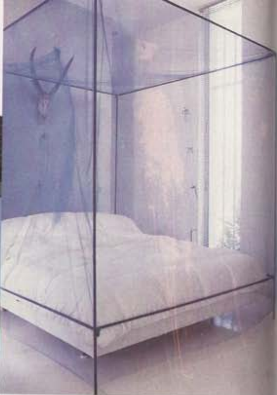
LÍNEAS PURAS. Suelos de mármol blanco, techos de acero galvanizado y una puerta basculante para la entrada (abajo, en la otra página). Arriba, detalle de la cama, con un dosel vanguardista.

“La parcela se concibe como una gran plataforma de una sola planta. Así, la unión entre el paisaje y la construcción vanguardista es impecable y respetuosa”