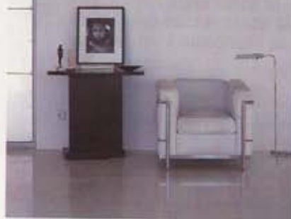
PIEZAS DE IMPACTO. Arriba, butaca LC4 de Le Corbusier y mesa auxiliar de Mackintosh. En la otra página, vista de la escalera interior y de los enormes ventanales, que disponen de puertas correderas, también de acero.